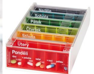
s návštěvou lékaře, chystáním léků