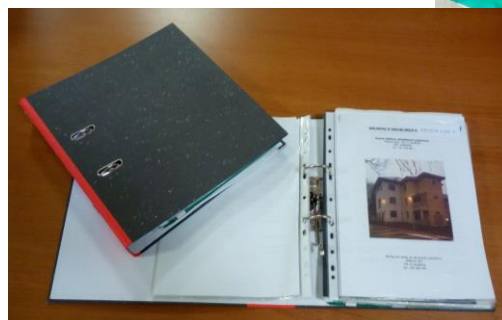
pomáhá mi s dokumenty a individuálním plánem