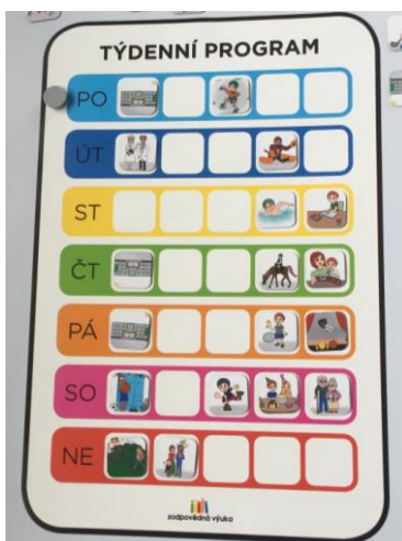
plánovat, co budeme dělat