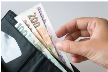
s hospodařením s penězi